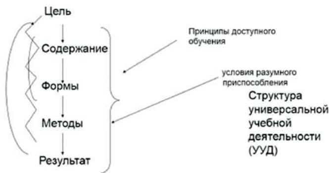
Рис. 3. Комплексный подход в осуществлении деятельности ДООЛ, в контингент которого входят дети с ОВЗ

Проводимое мероприятие должно быть целевым, с серьёзно проработанным содержанием; подготовкой к участию каждого отряда; наличием непосредственных проектных заданий для всех категорий детей (Рис. 3).